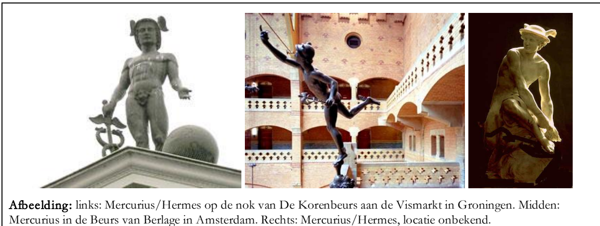
Afbeelding: links: Mercurius/Hermes op de nok van De Korenbeurs aan de Vismarkt in Groningen. Midden: Mercurius in de Beurs van Berlage in Amsterdam. Rechts: Mercurius/Hermes, locatie onbekend.

Het vlammetje op zijn petje verwijst naar het Mercuriuspetje, het hoofddeksel van Hermes/Mercurius, de boodschapper van de goden. Hermes heeft ook vleugels aan zijn voeten, daarom is hij snel en overal vlug bij.