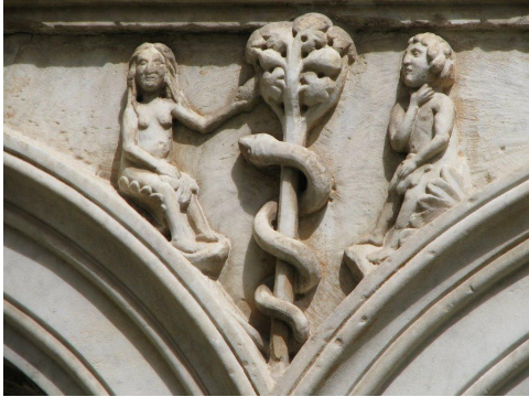
Afbeelding: Adam en Eva, afgebeeld in het kloosterhof van Sint Paulus buiten de Muren te Rome.

In het arcanum De Geliefden komt het geweten van de mens in ontwikkeling dat leidt tot het maken van bewuste keuzes. De mens kiest 'echt' voor een man of vrouw, of een liefdesrelatie met een roeping, verbindt zich in het 'echt' in het huwelijk bij het volgende grote arcanum De Priester. De mens is dan 'geëcht' en 'echt'geno(o)t(e).