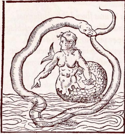
Afbeelding: Ouroboros, Emblemata Libellus Andreas Alciatus, Parijs 1542. De zee-god, Triton (zoon van Poseidon), omgeven door de Ouroboros 'De eindeloze zee', de oerzee, symbool voor Het Universum.

Het Universum is de laatste en tevens eerste kaart van de grote arcana in de Tarot: de creatieve potentie: de alfa en de omega: het kosmisch ei waar alles uit voortkomt en waar naartoe alles terugkeert als een leven ten einde is: niets gaat verloren (het collectieve onbewuste).